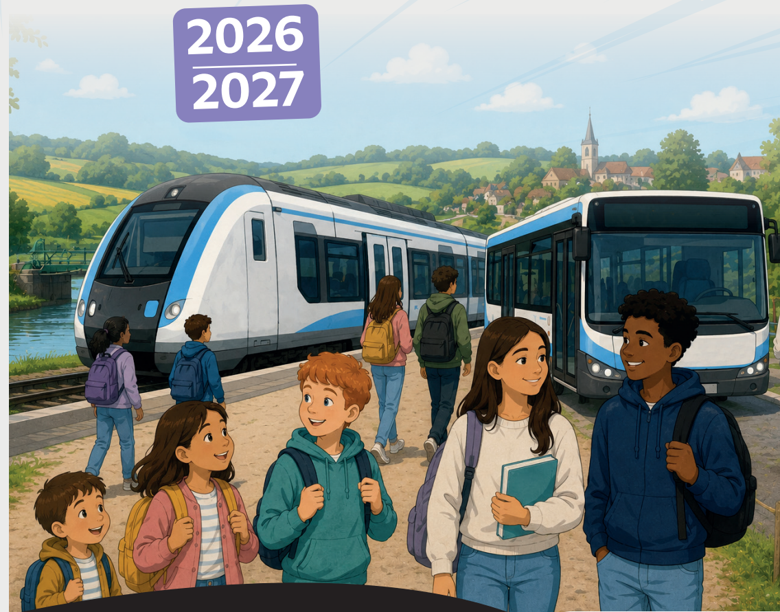
Photo et illustration issues de l'IA - Réalisation : CCPO - 06/2026