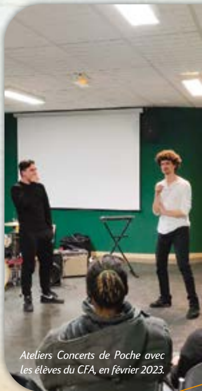
Ateliers Concerts de Poche avec les élèves du CFA, en février 2023.

Initier les enfants à la culture est une volonté majeure de la Communauté de communes du Pays de l'Ourcq. Dans cette optique, le spectacle L'expérience inédite sera joué une seconde fois le vendredi 19 janvier, en pleine journée, pour plusieurs classes de collégiens. Quant aux films Rasta Rockett et Wall-E , ils seront diffusés respectivement le vendredi 6 avril après-midi et le vendredi 17 après-midi pour les scolaires.