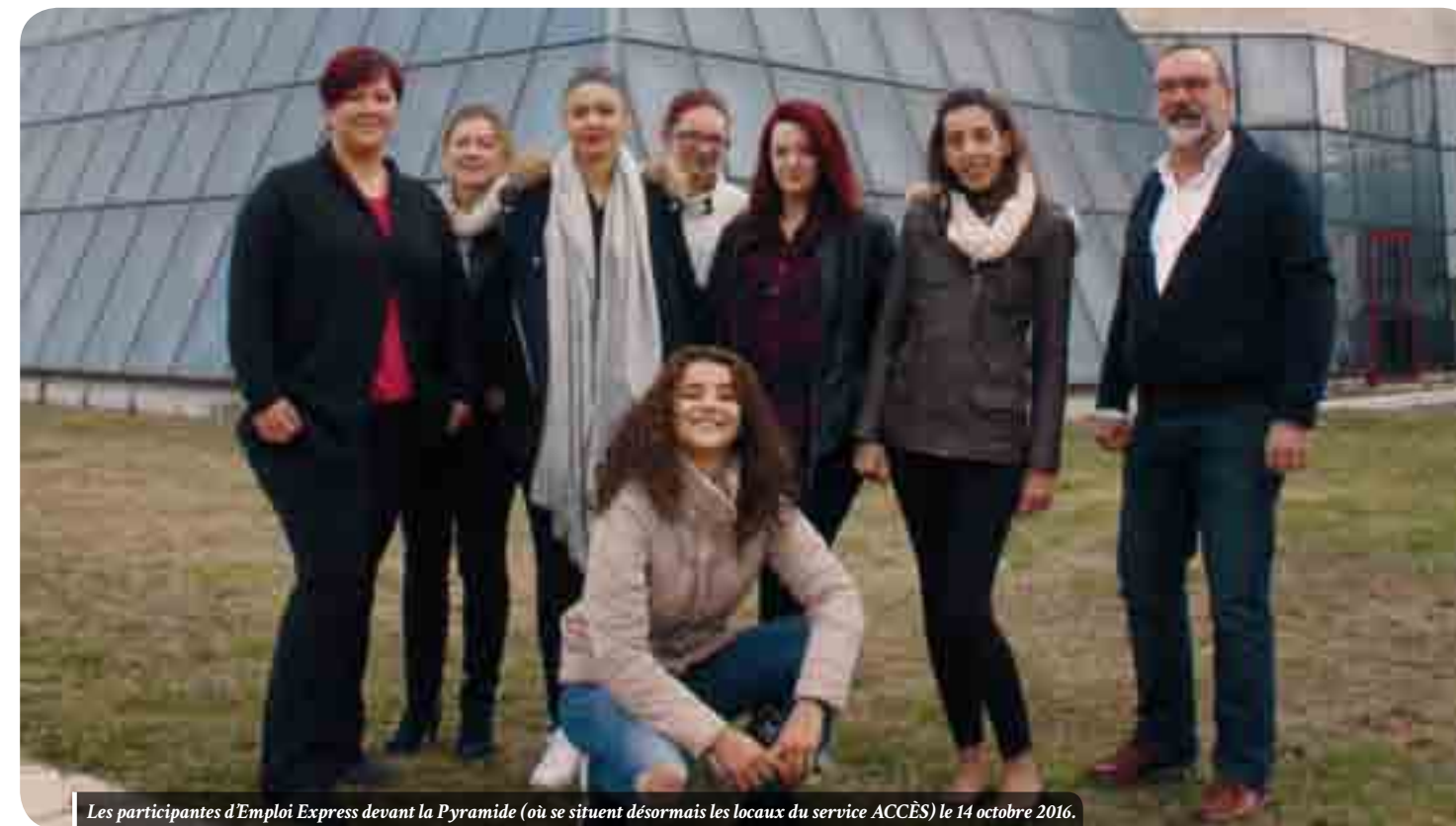
Les participantes d'Emploi Express devant la Pyramide (où se situent désormais les locaux du service ACCÈS) le 14 octobre 2016.