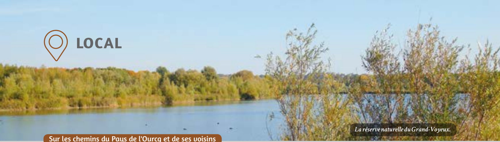
La réserve naturelle du Grand-Voyeux.

Sur les chemins du Pays de l'Ourcq et de ses voisins