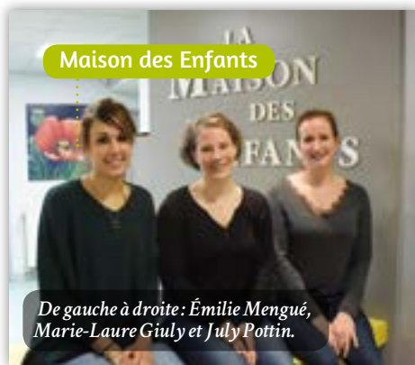
Maison des Enfants