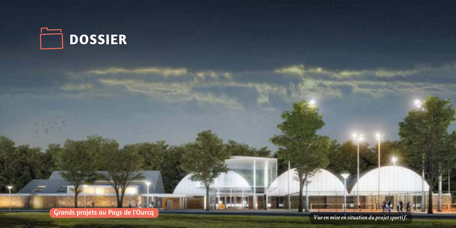
Grands projets au Pays de l'Ourcq