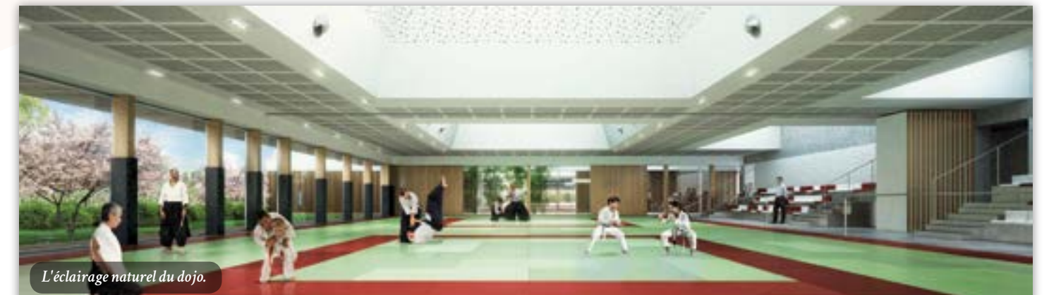
L'éclairage naturel du dojo.