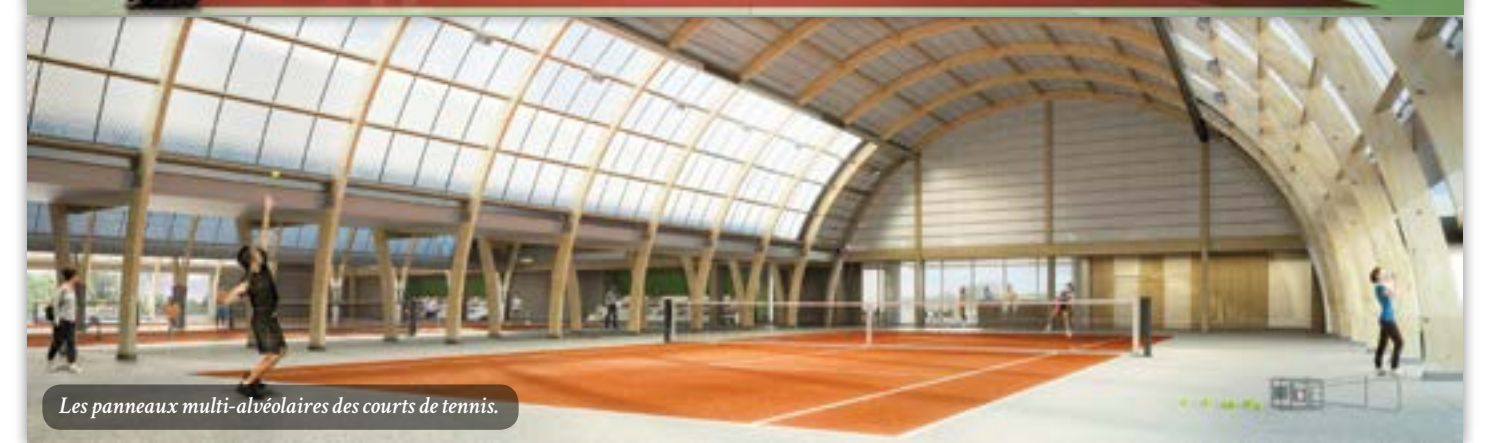
Les panneaux multi-alvéolaires des courts de tennis.