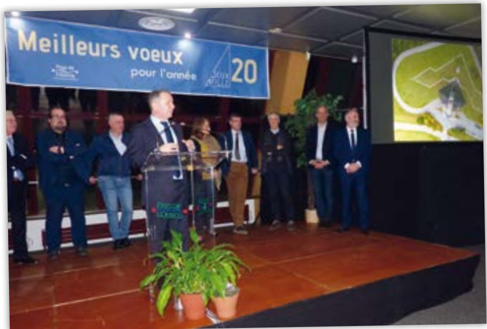
Lundi 20 janvier avait lieu la cérémonie des vœux, l'occasion pour la Communauté de communes de souhaiter une excellente année 2020 à ses partenaires ainsi qu'aux nombreux acteurs du territoire du Pays de l'Ourcq.