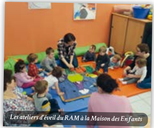
Les ateliers d'éveil du RAM à la Maison des Enfants

➤ Tél. 01 60 61 57 20 - relais-assmat@paysdelourcq.fr www.paysdelourcq.fr - f /maisondesenfantsocquerre