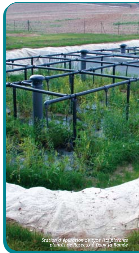
Station d'épuration de type lits filtrants plantés de Roseaux à Douy-la-Ramée

Lors de la Semaine Européenne de Réduction des Déchets, en novembre, 329 élèves du territoire (7 écoles) ont pu découvrir le spectacle « 9, rue de la Renaissance », par la Compagnie Ô, sur le thème des déchets. Étaient également présentés, une exposition sur les éco-gestes ainsi que des meubles en carton réalisés par des enfants des accueils de loisirs et une exposition de marionnettes de la Compagnie Ô.