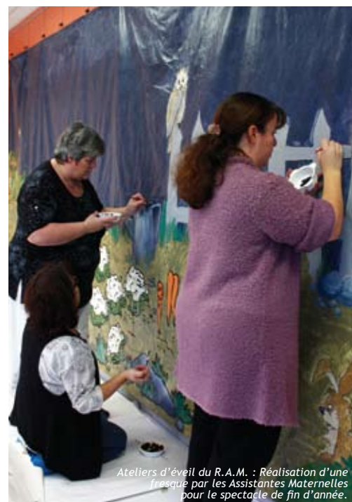
Ateliers d'éveil du R.A.M. : Réalisation d'une fresque par les Assistantes Maternelles pour le spectacle de fin d'année.