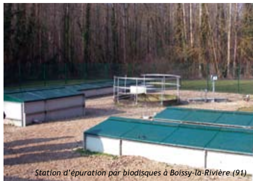
Station d'épuration par biodisques à Boissy-la-Rivière (91)