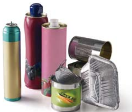
Ces emballages en métal se recyclent

Rappel : économisez l'eau ! Il est inutile de laver ces emballages avant de les mettre au bac bleu, bien les vider suffit amplement.