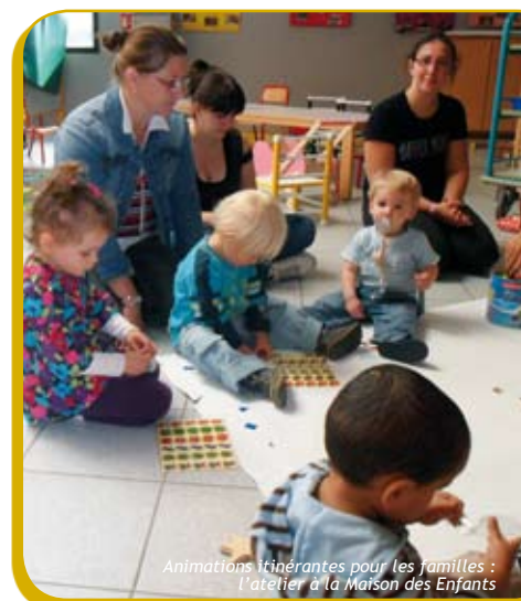
Animations itinérantes pour les familles : l'atelier à la Maison des Enfants