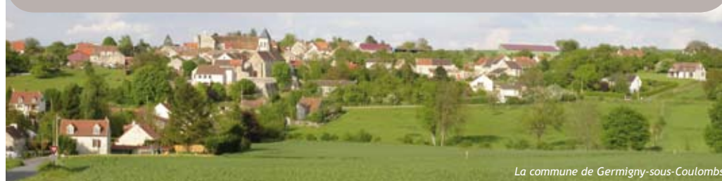
La commune de Germigny-sous-Coulombs

Mairie - Place de l'Eglise - 77840 Germigny-sous-Coulombs Tél. : 01 64 35 67 57 - Fax : 01 64 35 62 47 - mairie.germigny-sous-coulombs@laposte.net