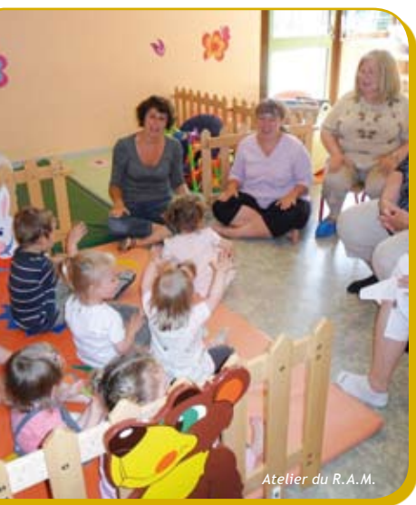
Atelier du R.A.M.