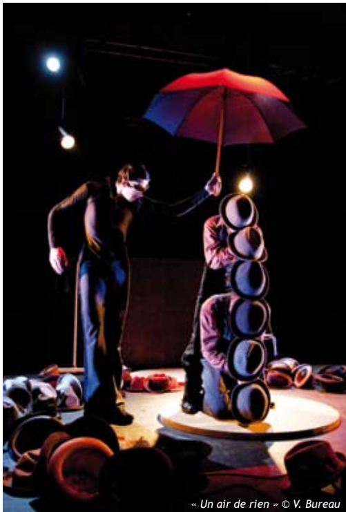
« Un air de rien » © V. Bureau

Regard sur la programmation culturelle à venir... Une fin de saison pour tous les goûts, à saisir et à apprécier en famille.