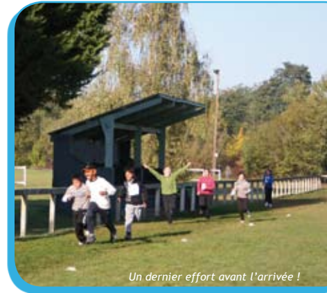
Un dernier effort avant l'arrivée !