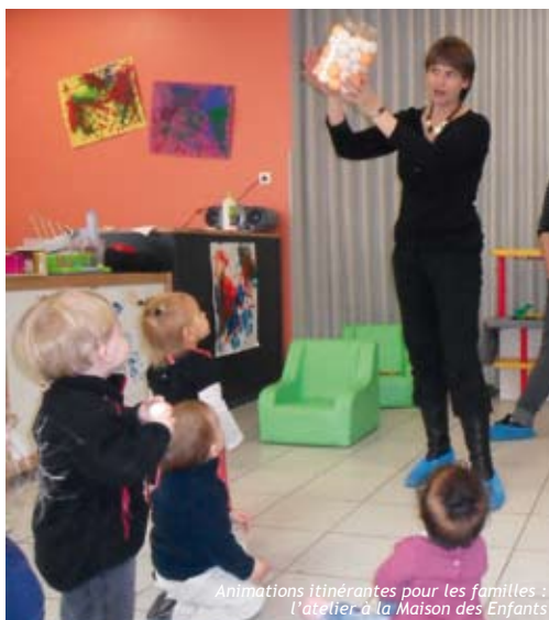
Animations itinérantes pour les familles : l'atelier à la Maison des Enfants

Dès le mois de janvier sera remise en place une troisième action : tous les mercredis matins, à Ocquerre, le Prêt de Jeux et Livres permettra aux enfants de moins de 6 ans et à leur accompagnant de découvrir des jeux, livres et CD, et les emprunter pour une somme modique (0,55 € à 1,05 €). L'objectif reste le même : aider les parents à passer avec leurs enfants du temps de qualité. « C'est le rôle de la référente famille, rappelle Angéline : accompagner le lien entre les parents, et leurs enfants. »