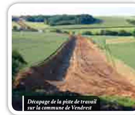
Décapage de la piste de travail sur la commune de Vendrest