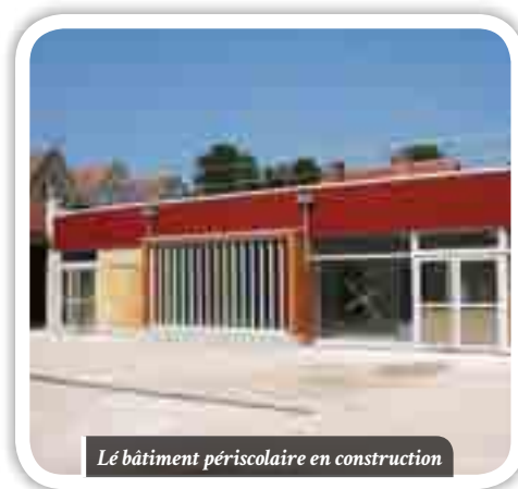
Le bâtiment périscolaire en construction

S'il est un domaine, cependant, dans lequel la Commune se refuse à l'économie, c'est l'enfance, la force vive du village : « Avec l'école et le collège, les petits Crouycois sont scolarisés sur place de 3 à 15 ans ! » Ainsi, la mise en application de la réforme des rythmes scolaires – autre gros projet de ce début de mandat – a entraîné une importante concertation avec les parents et les enseignantes... La reprise prochaine de l'accueil de loisirs par la Communauté de communes permettra de plus aux enfants de bénéficier de ce service à partir de 3 ans, le mercredi après la classe et toutes les vacances scolaires.