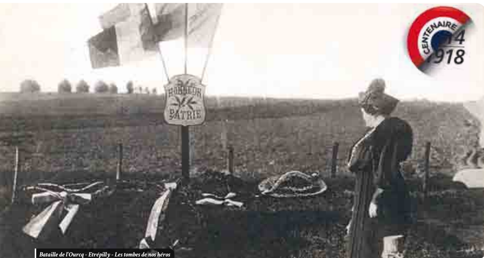
Bataille de l'Ourcq - Etrépilly - Les tombes de nos héros