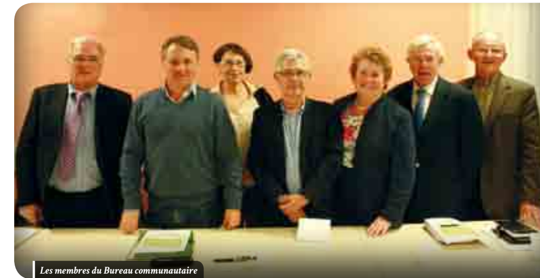
Les membres du Bureau communautaire

Retrouvez les résultats de ces différentes élections sur www.paysdelourcq.fr .