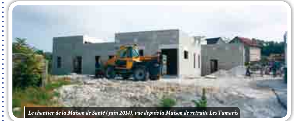
Le chantier de la Maison de Santé (juin 2014), vue depuis la Maison de retraite Les Tamaris

Travaux. La construction de la Maison de Santé pluridisciplinaire se poursuit à Crouy-sur-Ourcq ! La livraison du bâtiment est prévue en décembre 2014 pour une ouverture début 2015. → actionsociale@paysdelourcq.fr